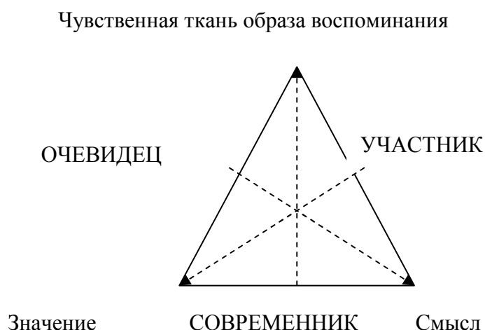
Рис.4. Психологические позиции Участника, Свидетеля и Современника относительно исторического опыта.

исторического компонента индивидуальной АП в контексте трех образующих сознания по А.Н. Леонтьеву (рис.2). Излагаются результаты пяти эмпирических исследований. Первое (N = 408) направлено на выявление представленности механизмов спонтанного включения исторического компонента, спонтанно включаемого в АП, определение преобладающей среди современных россиян позиции относительно исторических событий, анализ возрастных особенностей историчности АП. в зависимости от возраста. Во втором исследовании (N = 90) определялась взаимосвязь историчности АП и личностных характеристик. В третьем (N = 68) изучалась готовность испытуемых осваивать исторический опыт с различных психологических позиций. В четвертом проводился анализ культурной специфичности исторической памяти россиян по сравнению с представителями восьми других культур (N = 25). В пятом представлена процедура разработки опросника, выявляющего профиль направленности патриотизма (N = 144) и исследована взаимосвязь уровня патриотизма и степени историчности АП (N = 108).